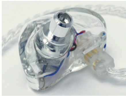
アルミ削り出しノズル

ノズルは国内生産によるアルミの削り出し品を採用しています。高い精度と仕上がりの美しさで安定した音質と所有する喜びを感じられます。