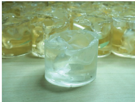
カナルワークスで保管している耳型

シェルの透明度などカスタム IEM の仕上がりの品質ではご好評をいただいておりますが、ユニバーサルモデルでもカスタムと同じように一つ一つハンドメイドで製作しています。シェルの形状については今まで数多くの耳型と向き合ってきた経験と資産を活かし、より多くの方にフィットする形状を実現しました。